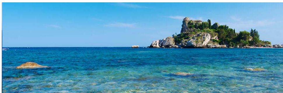
TAORMINA ISOLA BELLA